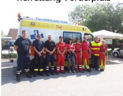
Eindrücke aus Deggendorf-Fischerdorf

Tierhilfe Kelheim e.V., Tierrettung Deggendorf, Tierrettung Rhein-Neckar e.V., Tierrettung Vorderpfalz